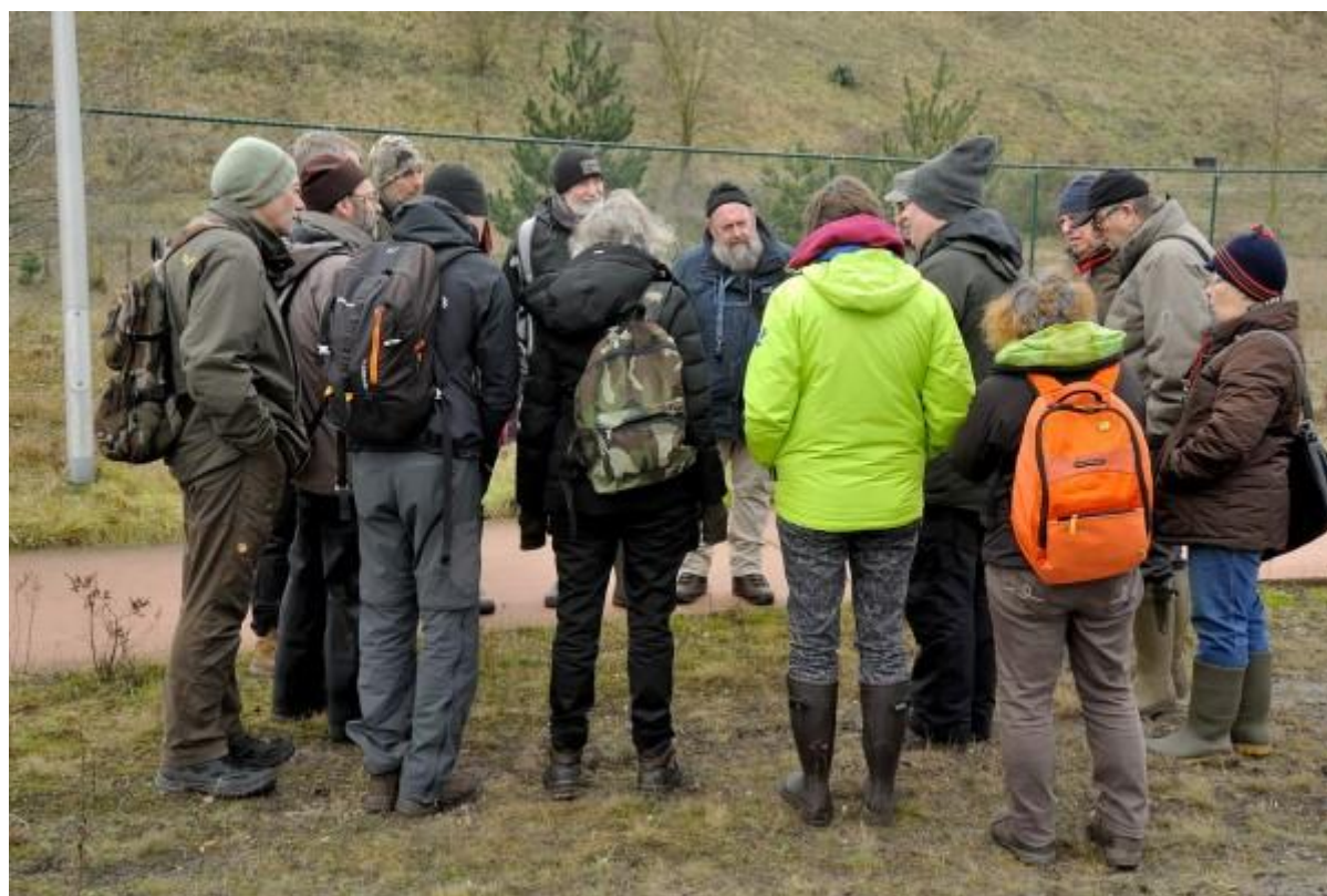
Heel wat belangstellenden voor onze cursus