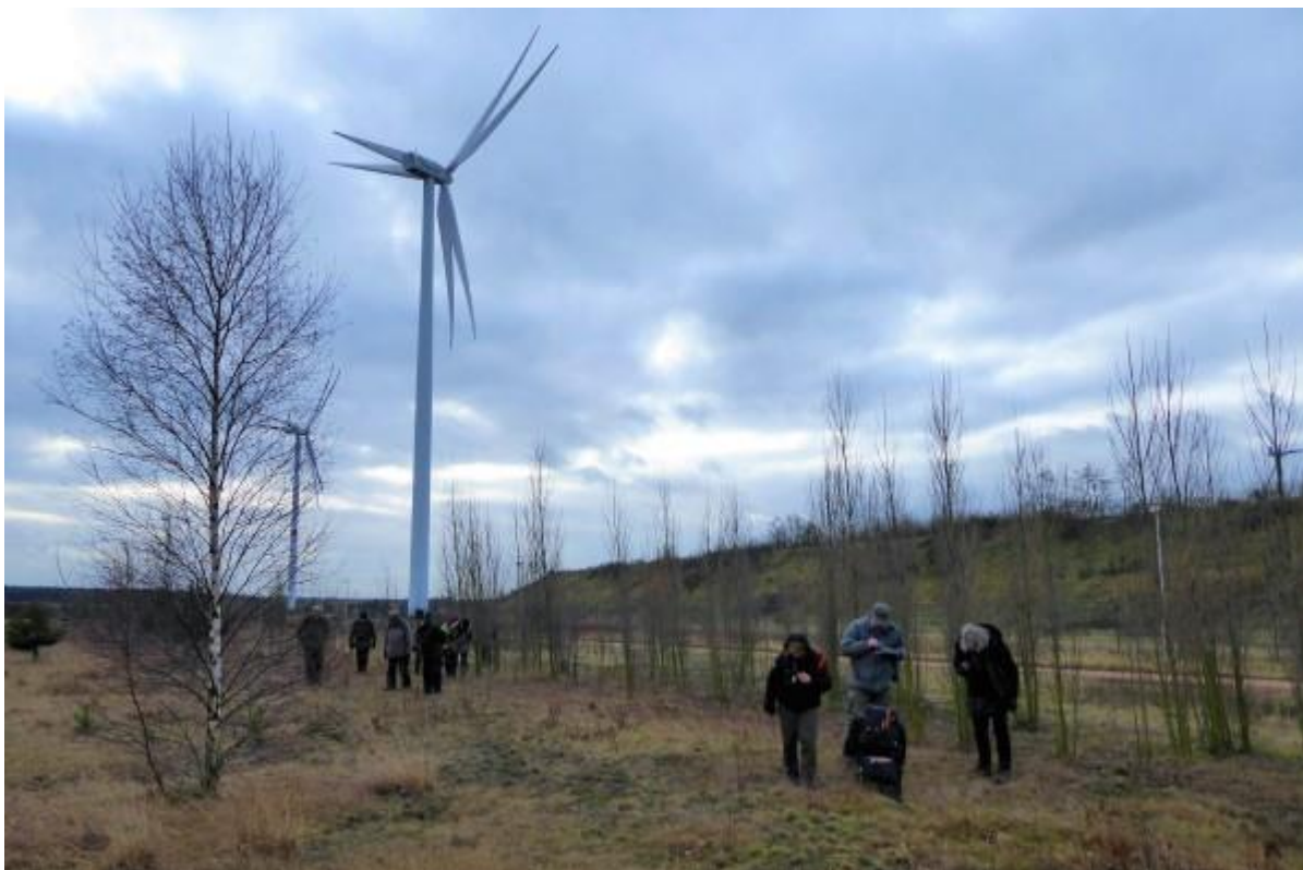
Korstmossen zoeken op de Balimgronden